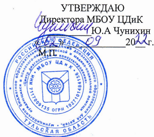
График контроля за состоянием охраны труда в образовательном учреждении на 2022-2023 учебный год